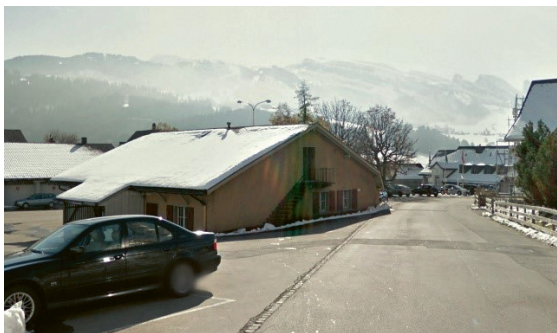
Schönenbodenstrasse, Blick Richtung Dorfplatz

Ursprünglich war geplant, die Einlenker der Schönenboden- und Dörflistrasse zusammenzulegen und den Verkehr über das heutige Trasse der Dörflistrasse in die Kantonsstrasse zu leiten. Die Zusammenführung der beiden Strassen sollte östlich hinter dem Werkhof erfolgen. Für die Schönenbodenstrasse direkt vor dem Hotel Sonne war eine Aufhebung beabsichtigt und die Kirchgasse sollte in die Dörflistrasse einmünden.